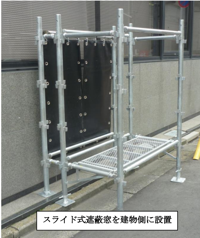
スライド式遮蔽窓を建物側に設置