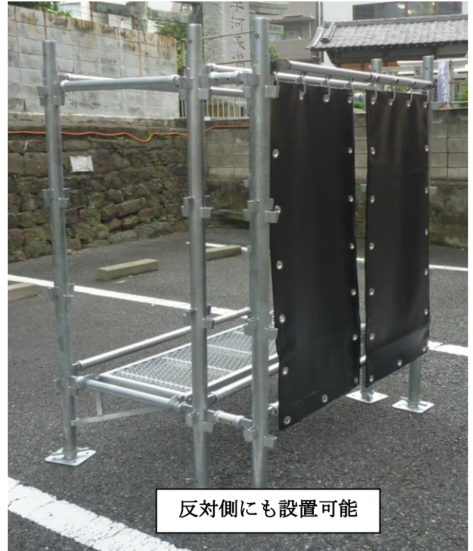
反対側にも設置可能